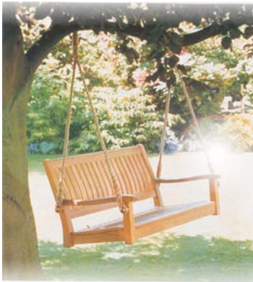
Ein lauschiger Sitzplatz zum Besinnen.

Wer bei der Formgebung des Gartens die überlieferten Prinzipien des Feng Shui beachtet, lenkt positive Energie in seine Umgebung und kann somit Wohlbefinden und Lebensqualität gezielt verbessern.